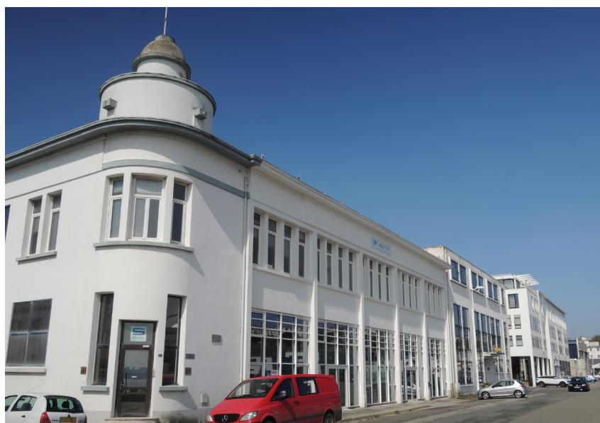
Bureaux au port de commerce - Arnaud Jaouen

La vacance baisse dans le reste du Pays de Brest et atteint environ 4 500 m 2 début 2015. Le Pays d'Iroise y contribue avec l'achat du bâtiment d'Avetis (Mescoat à Saint-Renan) afin d'y construire des pépinières. Bien