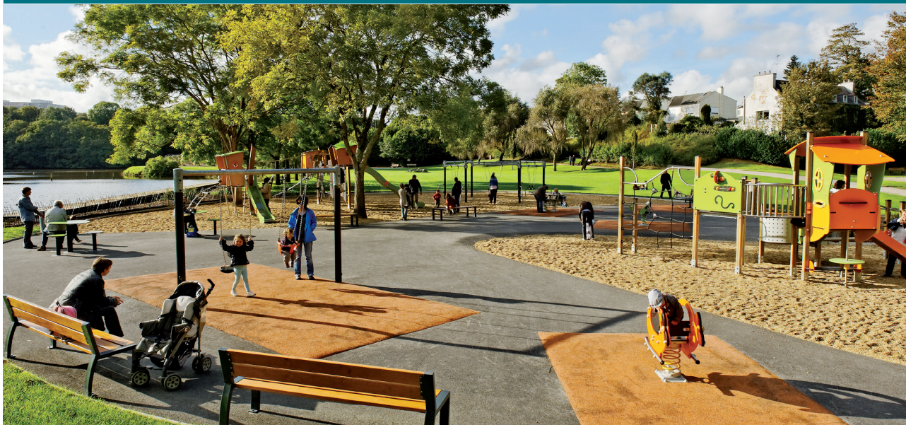
Crédit photo : Parc des Rives de Penfeld - Jean-Yves Guillaume / Brest métropole